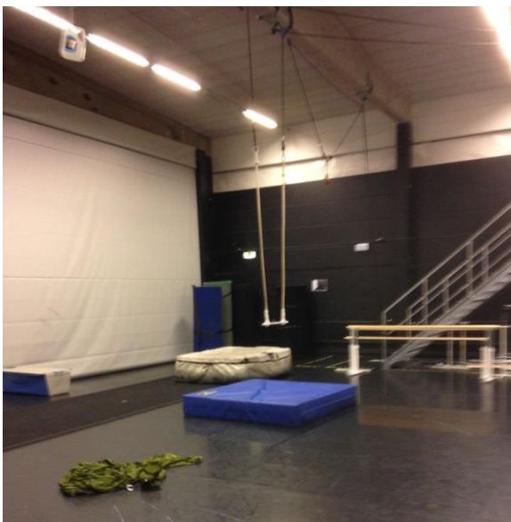
Trapeze van Cirkus Cikor

Bij de les van Cirkus Cikor was er de setting van 9 deelnemers met een verstandelijke beperking. Beperkingen als autisme en gedragsmatige stoornissen kwamen voor. Er waren drie begeleiders aanwezig. In het voorgesprek met de begeleiders bleek dat het de laatste les was voor een presentatie aan ouders. Ze werkten vanuit een thema: mine/yours/ours. Een voorbeeld van de invulling van het thema was de uitvoering met de bal die eerst werd gekoesterd als het ware van jezelf, daarna de bal geven aan de ander en ten slotte de bal delen d.m.v. overgooien in een kleine groep. Er werd in het begin van de les veel gepraat en geïnventariseerd en een ritme oefening gedaan met de groep. De werkmethode was voordoen van de begeleider, nadoen van de deelnemer (mirroring), daarna kreeg de deelnemer, individueel de tijd om verder zelf te ontdekken en te exploreren bijv. een handstand vervolgens kwam de begeleider terug voor feedback. De begeleiders waren constant bezig om de deelnemers aan te moedigen, te troosten, en te complimenteren. De deelnemers werden uitgedaagd om hun eigen grenzen te verleggen zoals letterlijk bijv. steeds langer op een bal lopen en mentaal gezien bijv. het zelfvertrouwen te vergroten.