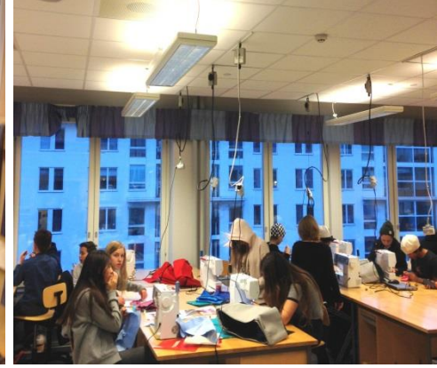
Textiel (stekkers uit plafond)