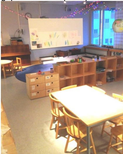
Forskolanruimte incl. piano en presentatiebord.

Op de brede school Sjöstadsskolan wordt veel aan kunstzinnige vorming gedaan. Bij de Forskolan werkt men met het concept van Reggio Emilia hetgeen inhoudt dat er veel ruimte is voor onderzoek voor de kinderen in combinatie met allerlei kunstdisciplines. Er staat bijv een piano en elke dag zingt de begeleider liedjes met de groep en veel opdrachten worden gepresenteerd op het presentatiebord.