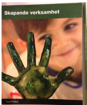
Het creatieve activiteitenboek voor OA.

Op het Ronninge Gymnasium bieden ze een vergelijkbare opleiding aan als onderwijsassistent. In Zweden noemen ze het Pupils assistent bedoeld om de leerling te assisteren in zijn werkzaamheden. In Nederland is het gebruikelijk om juist de leerkracht te ondersteunen in diens taken t.b.v. de leerling. Er is geen dans of drama in het programma. Beeldend wordt wel aangeboden als aparte leerlijn. Muziek als item is niet of nauwelijks aanwezig. Het wordt wel ingezet in presentaties als middel. De leerlingen werken vanuit een activiteitenboek en krijgen les over betreffende kunstzinnige activiteiten om die professioneel in te zetten in het beroepenveld.