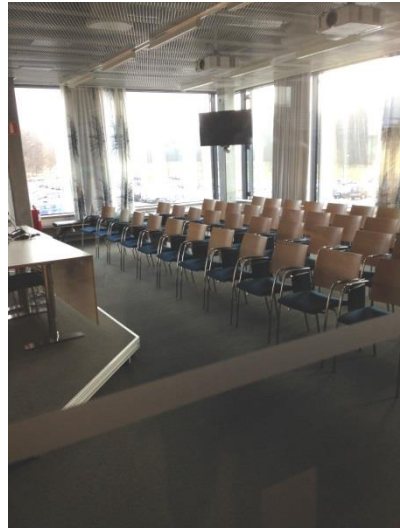
Kleine hoorcollege zaal