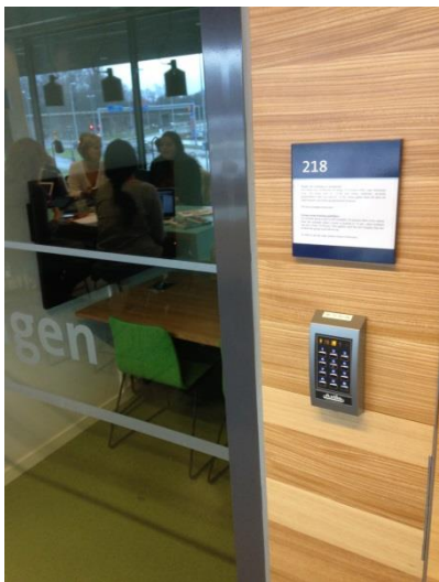
Te reserveren studieruimte

ruimtes. Ook was er een kantine die gecombineerd werd met studeren, een multifunctionele ruimte derhalve. De rest was juist met een specifieke bestemming van aard.