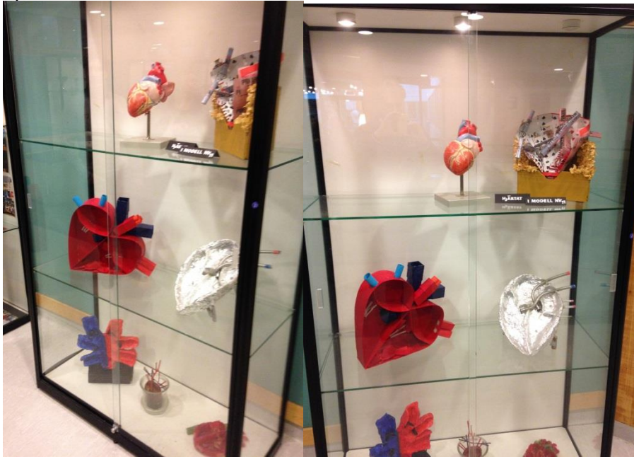
Het creatieve hart.

begrijpen om verder een creatie te maken en daarbij wordt het gekoppeld aan poem reading om de studenten vanuit zelfvertrouwen een stem te geven. Op deze manier wordt kunst (drama) niet zelfstandig gebruikt maar het is geïntegreerd in professionele situaties. Verder gebruikten ze veelal het middel films om opdrachten uit te werken. Men vond film een goed instrument omdat het een interdisciplinaire samenwerking vereist tussen de kunstvormen, zoals beeld, geluid en verhaal. Een voorbeeld daarvan was het verfilmen van een levensboek waarin geschiedenis van 3 generaties aan de orde kwam. Een ander voorbeeld van het gebruik maken van kunst waarbij het gaat om professionele ontwikkeling is te vinden in het programma van gezondheidszorg waarin studenten een hart op een creatieve manier moesten uitbeelden.