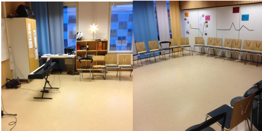
Opstelling van muzieklokaal

De vaklokalen zijn uitgebreid geoutilleerd in materialen. Het muzieklokaal bevat geen werktafels, er is een U opstelling.